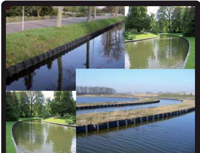
BESCHOEIINGEN (Lengte/ doorsnede op aanvraag)