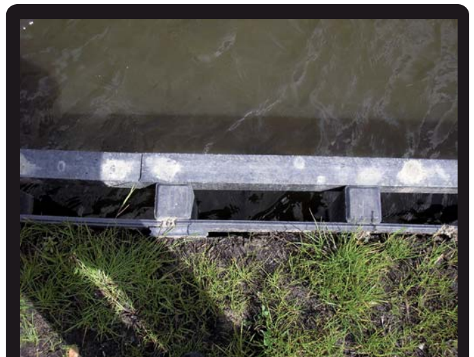
BESCHOEIING MET WRIJFSTIJL (Maatwerk)

KUNSTSTOF BEWERKING OP MAAT :: ONVERWOESTBAAR & MILIEUVRIENDELIJK