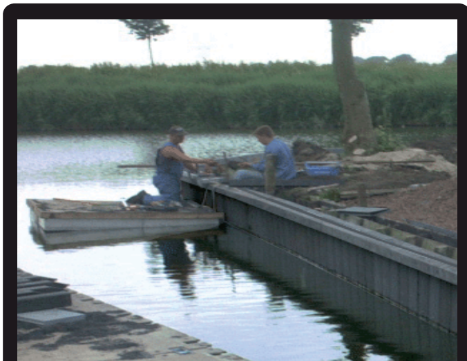
DAMWANDEN (MAATWERK) (Maatwerk)