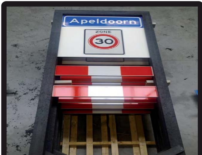
PLAATSNAAMBORDEN (Lengte/ maten/ kleuren op aanvraag)