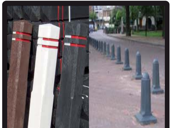
DIAMANTKOPPAAL/ ACHTKANT SIERPAAL (Lengte/ doorsnede/ kleur op aanvraag)