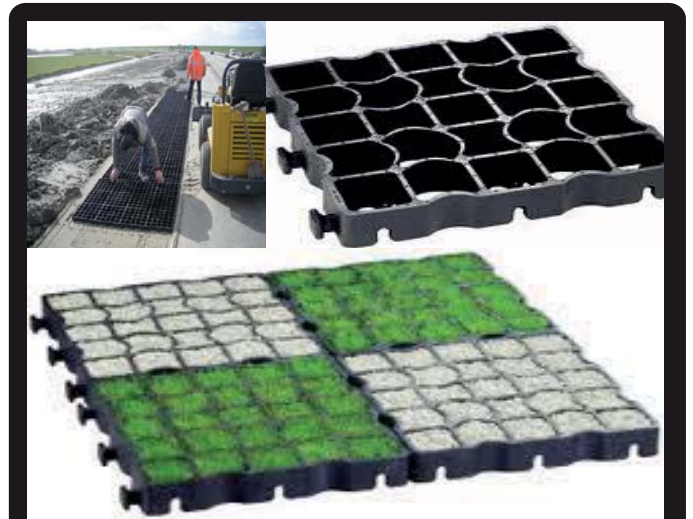
ECORASTER (FUNDATIEPLATEN ZWART) L 33,3 cm B 33,3 H 3,4 of 5 cm