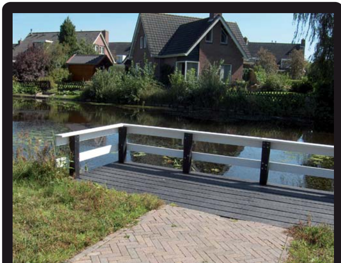
STEIGER MET LEUNING (Maatwerk)