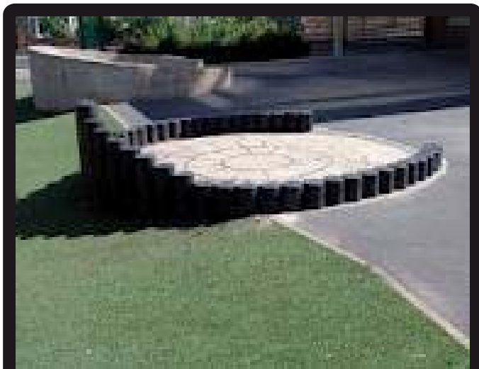
PALISADEN (Lengte/ doorsnede/ kleur op aanvraag)