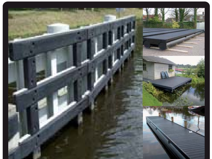
WRIJFSTIJLEN EN (DRIJVENDE) STEIGERS (Maatwerk)